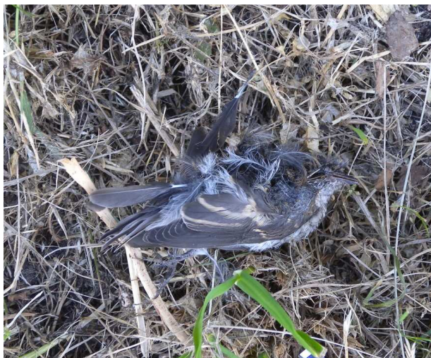
Muchołówka żałobna juv.