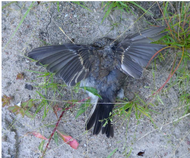
Muchołówka żałobna juv.